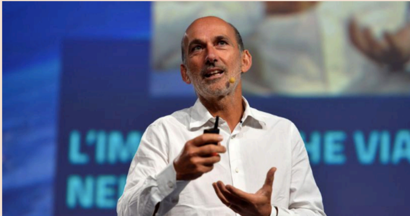
Fabio Cannavale (Imagoeconomica)